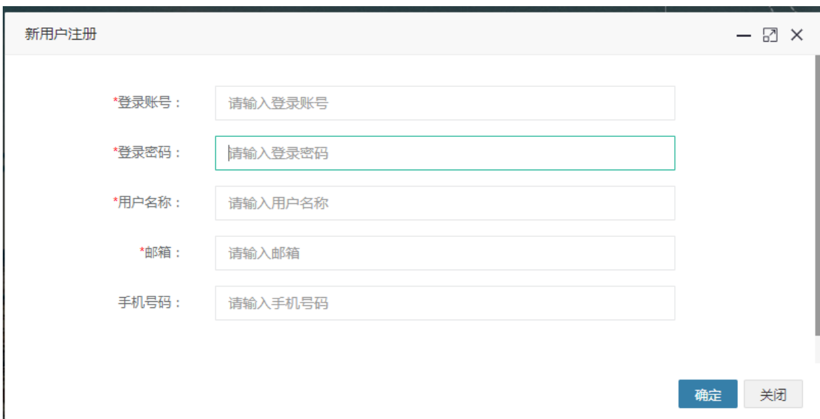
图 3: DFOTA 工具新用户注册界面