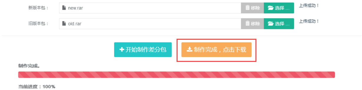
图 6：差分包制作完成