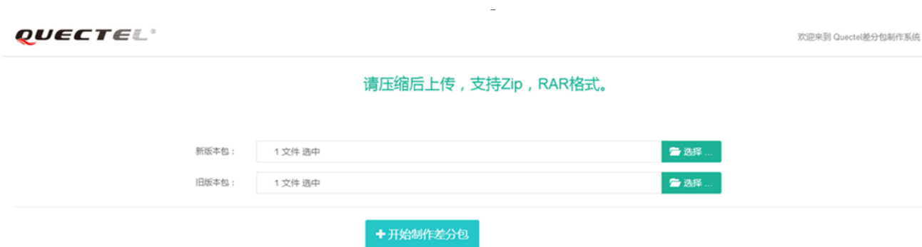
图 4: DFOTA 工具差分包制作界面